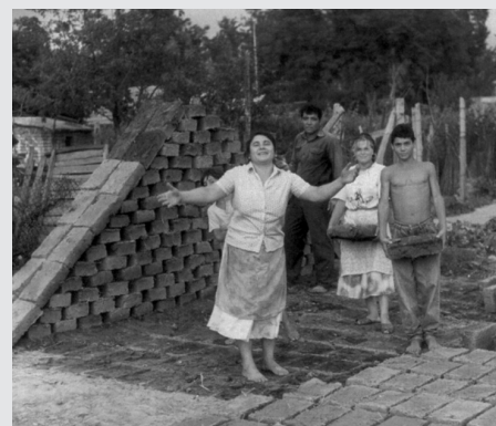
III. 7 Výrobcovia tehál z mesta Craiova, Rumunsko (Djurić/Becken/Bengsch 1996, str. 184b)

Pri značnom zjednodušení môžeme povedať, že vo východnej Európe existovali dva modely národnostnej politiky, ktoré je možné definovať ako „etno-národnostná“ a ako „post-imperiálna“. Prvý model dominoval v Poľsku, Maďarsku, Rumunsku, Bulharsku a v Albánsku (Československo k nim môžeme priradiť tiež, avšak s istým obmedzením, pretože to bol federálny štát pozostávajúci z dvoch krajín). Tieto krajiny tvoril jeden národ (v Československu dva), čo poskytovalo základ pre „národný štát“