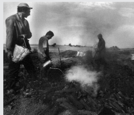
III. 4 Výrobcovia dreveného uhlia, Bulharsko (Rolf Bauerdick. Z Guy 2001, str. 328)