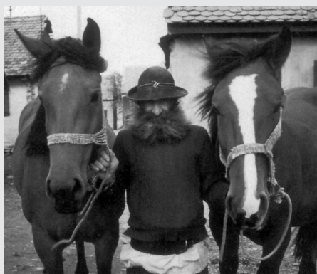
III. 6 Obchodník s koňmi, Rumunsko (Djurić/Becken/Bengsch 1996, str. 184b)