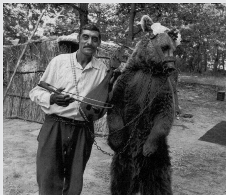
III. 3 Ursari, krotiteľ medveďov, Bulharsko (Rolf Bauerdick. Z Guy 2001, str. 328)