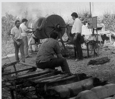
III. 5 Obchodníci s kovom z mesta Meteol, Rumunsko (Djurić/Becken/Bengsch 1996, str. 184b)